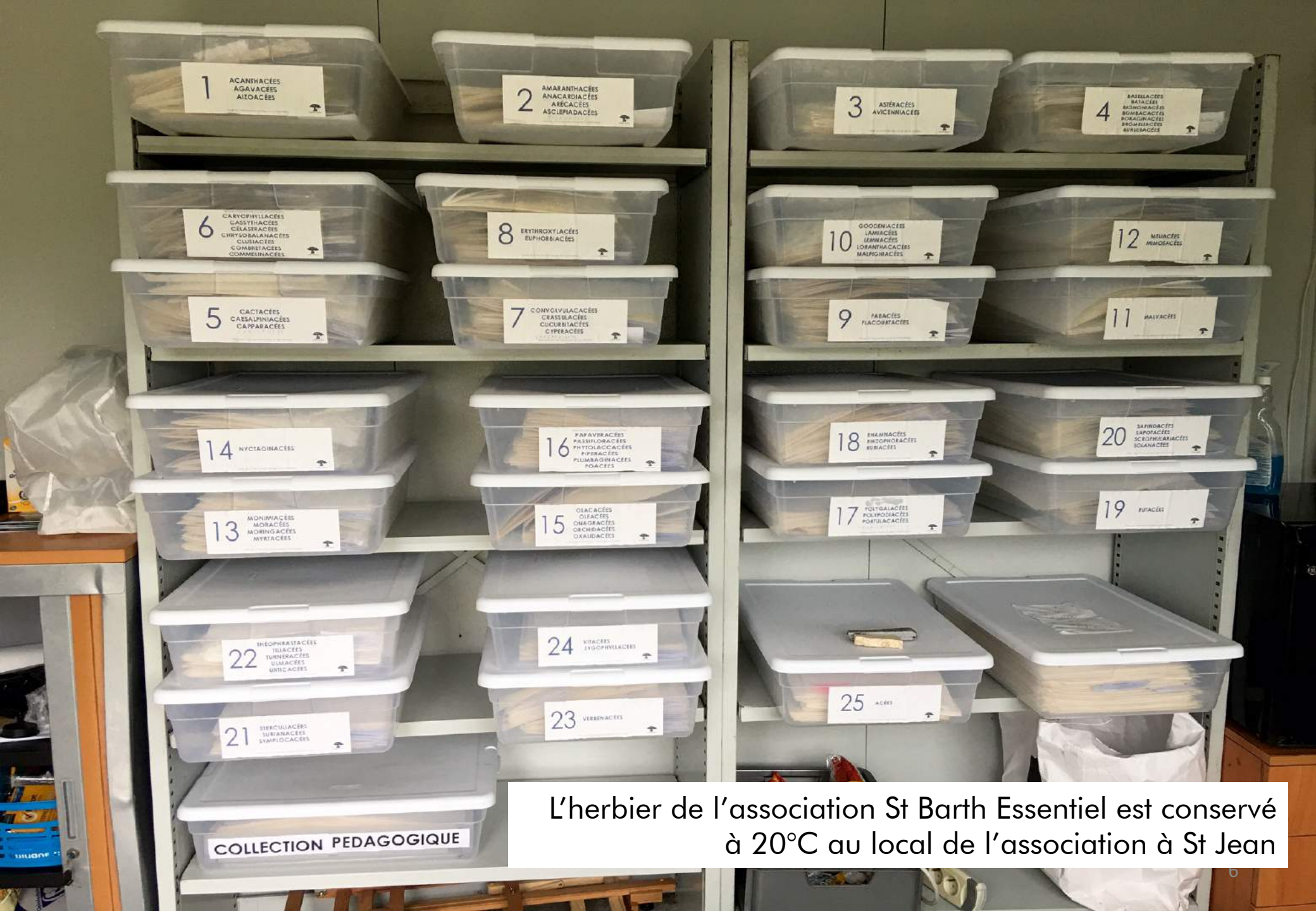
L'herbier de l'association St Barth Essentiel est conservé à 20°C au local de l'association à St Jean