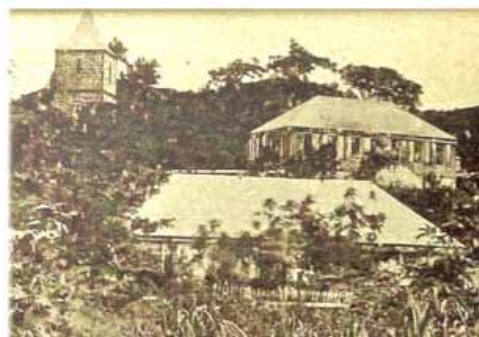
▲ Photo prise vers 1900 montrant le clocher à gauche, la petite église bâtie en 1820 et le presbytère.

d'essentes sans débord pour éviter la prise au vent. Une seule ouverture fait office d'entrée et un petit percement vertical, de type meurtrière, existe sur chacune des quatre faces, en partie haute.