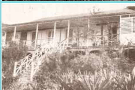
Photo 2 : l'ajout d'une galerie crée date vraisemblablement de la fin du 19 e . DR

Photo 1: le presbytère entre 1865 et 1870. Il est alors composé d'un bâtiment unique et d'un petit jardin au milieu duquel se trouve le premier clocher de l'église (Carl Constantin Lyon entre 1865 et 1870 - collection A.M)