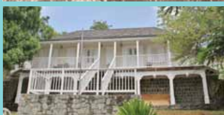
Photo 3 : le presbytère après la rénovation de 2009

Photo 2 : l'ajout d'une galerie crée date vraisemblablement de la fin du 19 e .