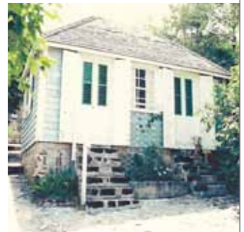
▲ Les cases d'esclaves avant et après rénovation - (Photos de Bengt Sjögren et Philippe Hochart, 1993).